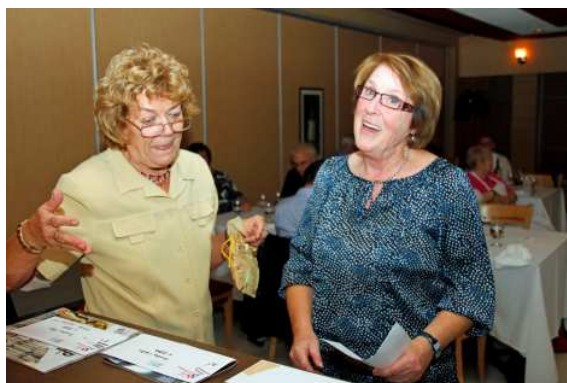
Une gagnante heureuse!

le tout accompagné de vins de la région.