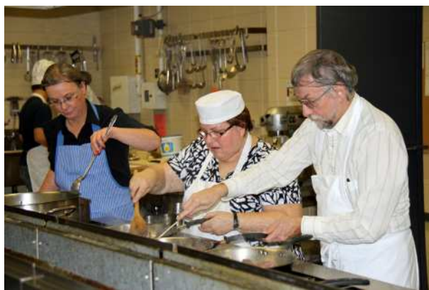
C'est du sérieux!