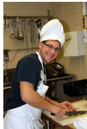
Un vent de jeunesse en cuisine!