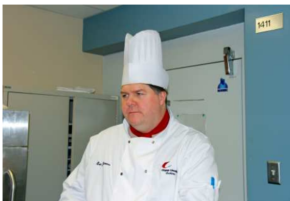
Quelque chose ne va pas?