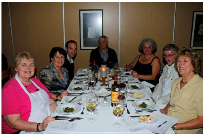
De joyeux convives!