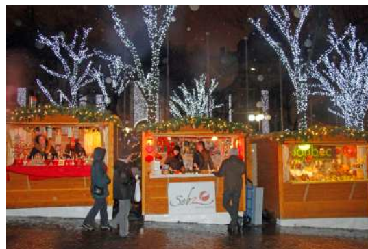
La féerie du marché le soir