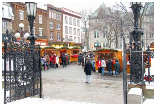
L'entrée du marché devant la cathédrale