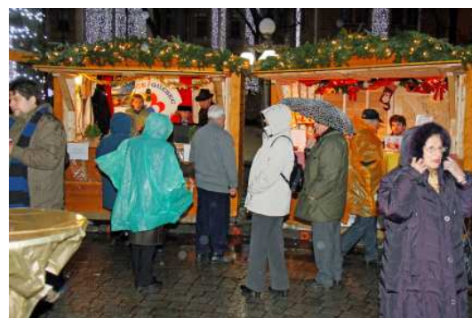
Sous la pluie!