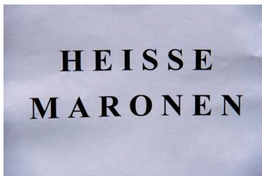
L'annonce du kiosque de marrons chauds

Nous avons distribué beaucoup de documentation sur l'Association Québec-France et les prochaines activités. Ce fut dommage que l'office du tourisme d'Alsace n'ait pu envoyer assez de documentation en temps opportun afin de répondre aux nombreuses demandes sur les marchés de Noël là-bas. Nous avons d'ores et déjà beaucoup de nouveaux membres suite à cette activité.