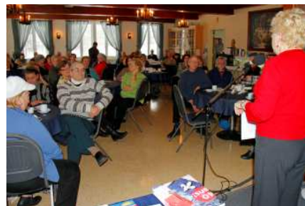
Une salle très attentive

Plusieurs s'intéressaient à la façon de vérifier la présence de Filles du Roy dans leur lignée ancestrale. Certains se sont même mis à l'œuvre pour commencer leurs vérifications avec l'information disponible sur place! L'activité a été une grande réussite.