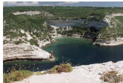
Bonifacio, le port