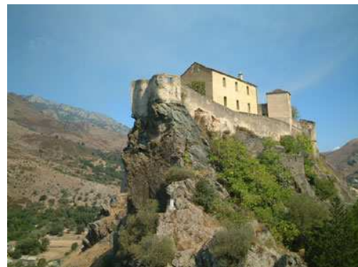
Corte, la citadelle