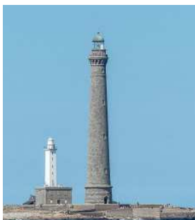
Les phares de l'île Vierge

Ainsi dans la baie de Morlaix, il est possible de dormir dans le phare de l'île Louët , même chose pour le phare de Kerbel à Riantec.