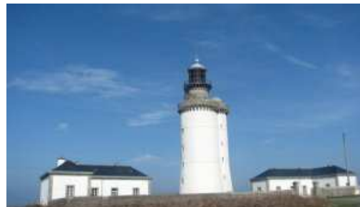
Phare du Stiff