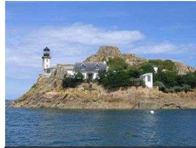
Phare de l'île Louët