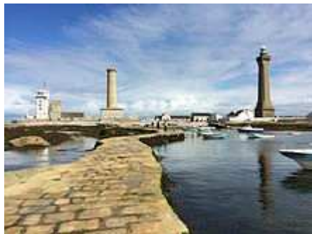
De gauche à droite : le sémaphore, la Vieille tour, la chapelle Saint-Pierre, le Phare de Penmarc'h et le phare d'Eckmühl .

Beaucoup sont construits en bordure de l'océan, face à des endroits particulièrement dangereux; un des plus célèbres est le phare d' Eckmühl près de Penmarch. Pourquoi ce nom? C'est le titre d'un maréchal de Napoléon, prince d'Eckmühl. C'est sa fille qui a donné l'argent nécessaire pour la construction de ce phare, voulant racheter par des vies sauvées les tués des guerres.