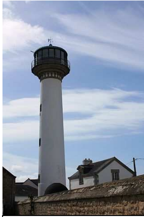
Phare de Kerbel