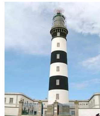
Phare du Créac'h